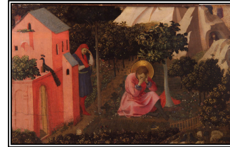
Conversion de saint Augustin

Priuresaintbenoit.wordpress.com – 01 30 43 71 71 – contact@priuresaintbenoit.fr